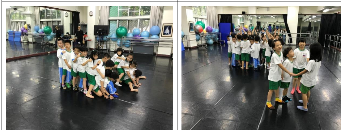
說明：合作力量大課程動作引導