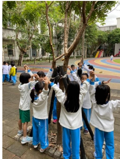
說明：想像圍繞著樹蓋房子