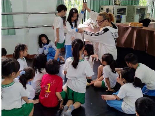
說明：老師與同學舉例蓋房子的想像