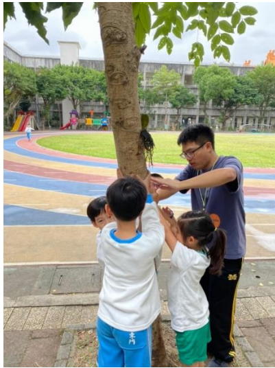
說明：想像鳥兒休息要靠到樹上