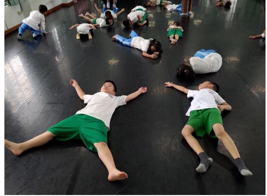
說明：想像自己是睡著的小鳥