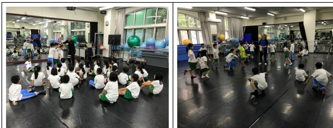
說明：超級模仿家課程示範